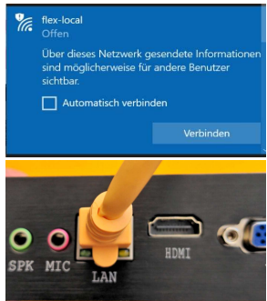
2. IP-Adresse im Browser aufrufen