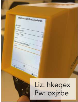
Liz: hkeqex Pw: oxjzbe