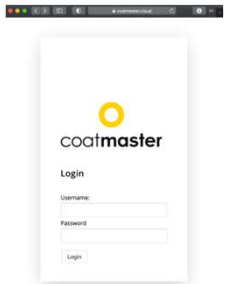
Wi-Fi: 10.10.0.1:9080 LAN: 192.168.10.146:9080