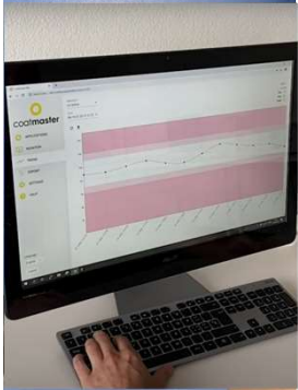
4. Daten exportieren