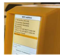
Wi-Fi im gleichen Netzwerk wie der Local Server