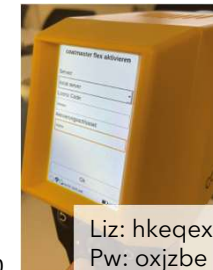
Liz: hkeqex Pw: oxjzbe